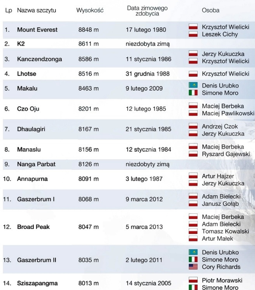
Rys. 1. Korona Himalajów – pierwsze zimowe wejścia.