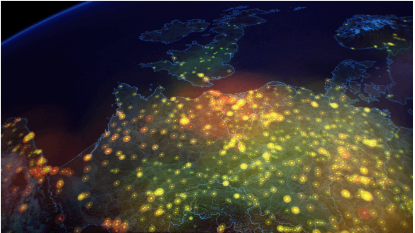
Jakość powietrza i poziomy zanieczyszczeń w całej Europie