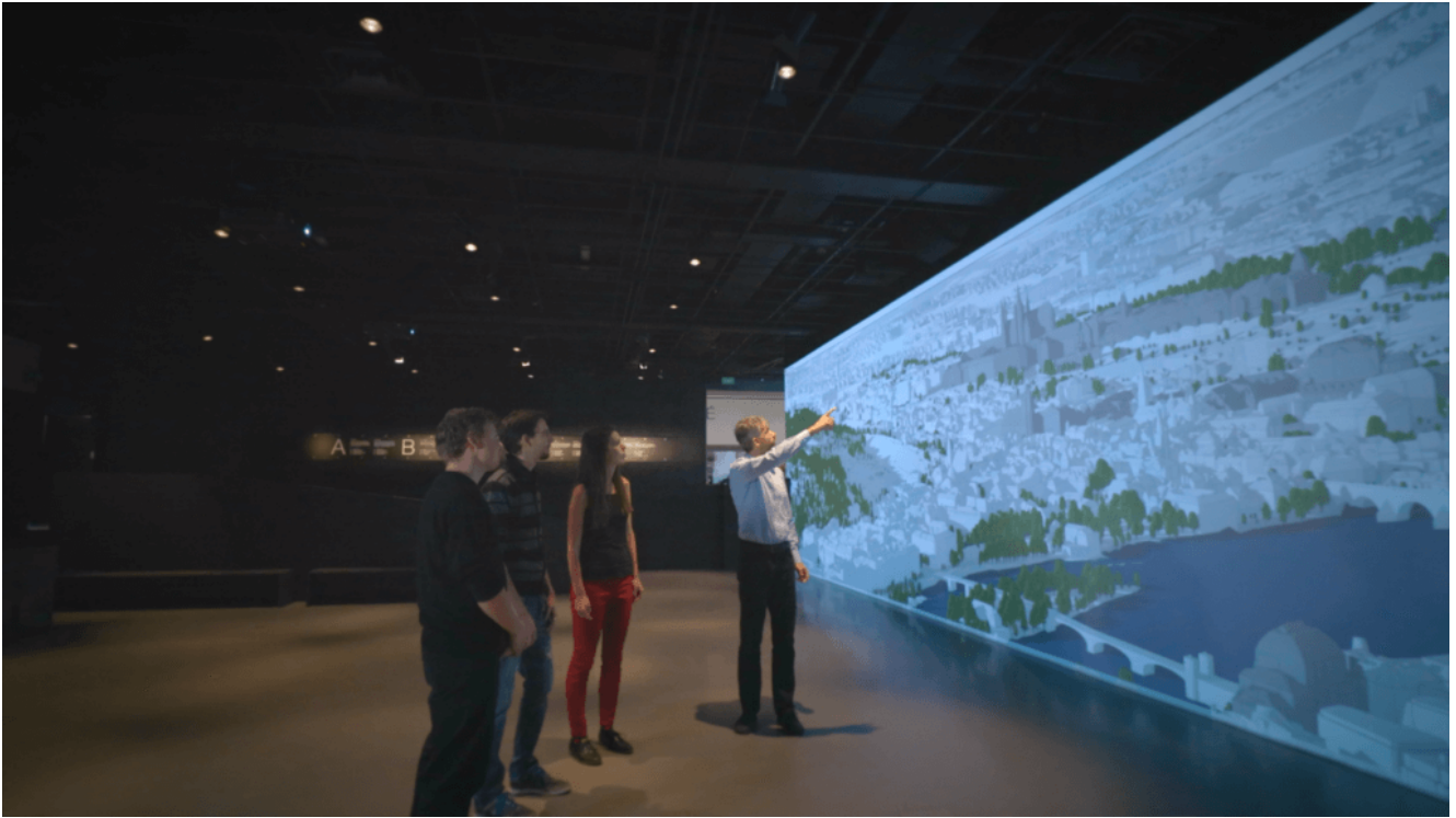
Obywatele widzą wyniki w Centrum Architektury i Planowania Metropolitalnego