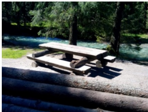
Fot. 1. Zdjęcie ławostołu wykonane podczas warsztatów, które odbyły się w Tatrzańskim Parku Narodowym w dniach 22–23 maja 2014 roku.

W aplikacji Collector for ArcGIS można aktualizować istniejące dane. Dzięki temu zebrane informacje będą zapisywane na serwerze i widoczne również dla innych pracowników terenowych. Aktualizacja dotyczy modyfikacji atrybutów i lokalizacji obiektów, a także dodawania i usuwania obiektów czy też tylko danych powiązanych z obiektami, czyli zdjęć lub innych załączników.