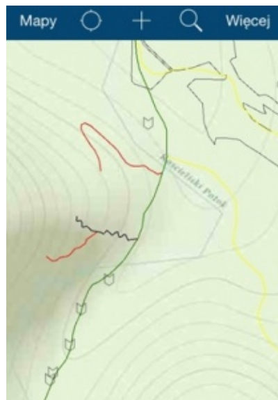
Rys. 3 a. Mapa do zbierania danych dotyczących stanu technicznego obiektów zlokalizowanych na szlaku turystycznym na terenie Doliny Kościeliskiej – wodopustów udostępniona została użytkownikom

Z poziomu aplikacji Collector for ArcGIS można zbierać dane w terenie, korzystając z geobazy plikowej przygotowanej wcześniej w oprogramowaniu ArcGIS for Desktop. Dzięki wykorzystaniu domen w geobazie plikowej dla warstw do edycji przy gromadzeniu danych w terenie użytkownik może korzystać z atrybutów pól z rozwijalnej listy.